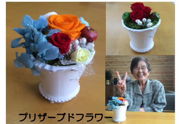
プリザーブドフラワー