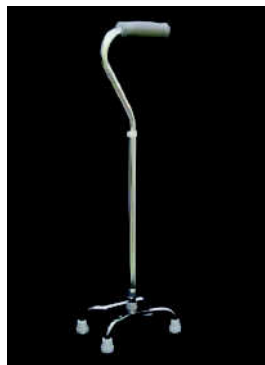
四点杖 （安定がよく、手を放し ても立っている）