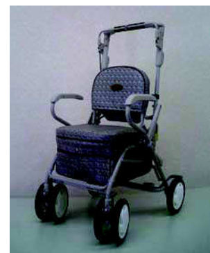
シルバーカー （荷物を運んだり、腰掛 けて休める。避難所、施 設内でも使える）