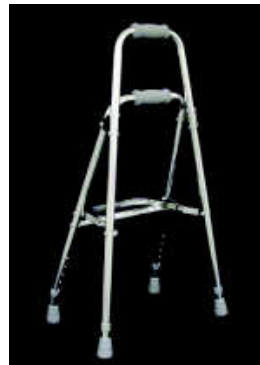
ウォーカーケイン （非常に安定がよく、 多少もたれても大丈夫）