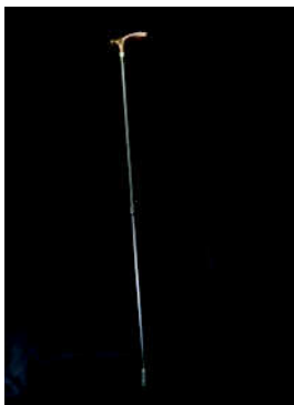
T字杖 （これだけと 考えないように）