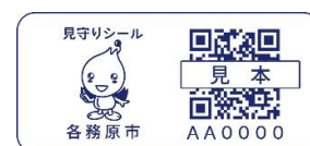
見守りシール見本