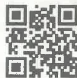
どこシル伝言板 紹介ページ