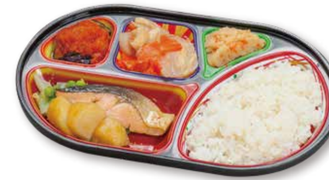
鮭のバター醤油焼き

おかずのみ 822円税込 おかずとごはん 876円税込 おかずとたんぱく調整ごはん 926円税込