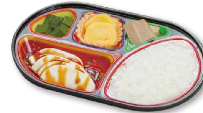
うなぎの蒲焼ムース

食べ物を噛むことや、飲み込むことが困難な方に適したムース食です。見た目の美味しさや料理の香りも兼ね備えているので、美味しい食事を安心してお召し上がり頂ける新しい食事形態です。 おかずのみ 648円税込 おかずとごはん 702円税込