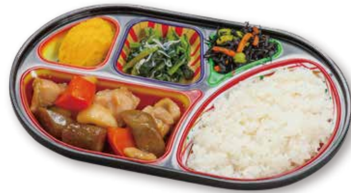
鶏肉と根菜の煮物

カロリーをバラつきの少ない一定の値に調整し、栄養バランスの良いカロリー計算が必要な方に適したお弁当です。ダイエットや食事療法も無理なく続けられます。 おかずのみ 772円税込 おかずとごはん 826円税込