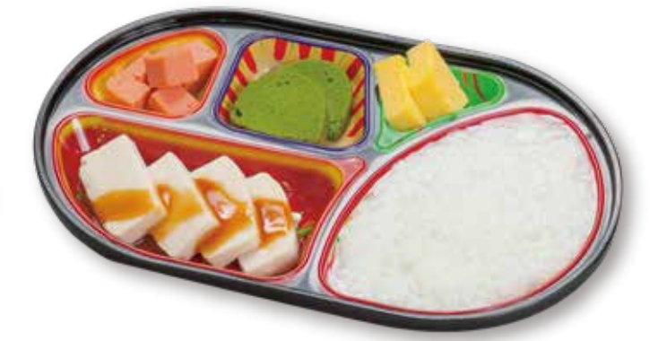
牛すき焼きムース