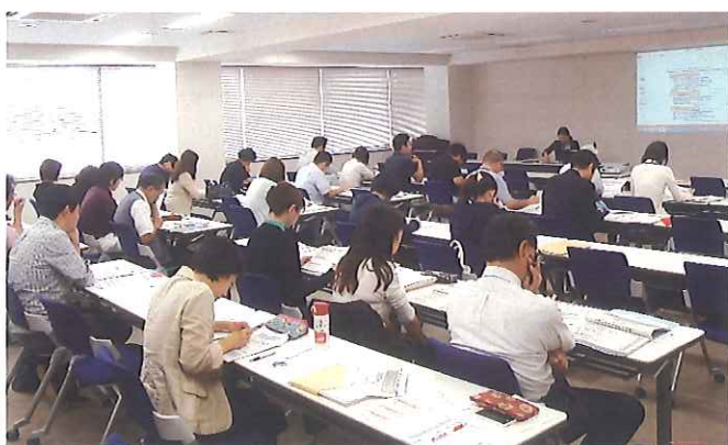
昨年の説明会の様子

認定基準についての説明や取組に向けての課題の整理、人材育成や評価制度等、個別の課題についてのアドバイス、相談