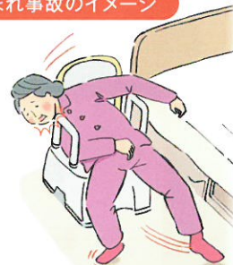
はさまれ事故のイメージ

ご使用中のお客様には大変ご迷惑をおかけいたしますことを深くお詫び申し上げます。何卒ご理解とご協力をお願い申し上げます。